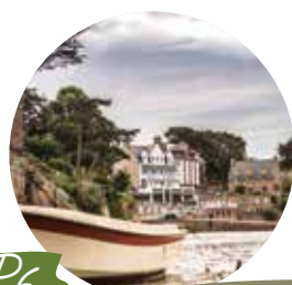
P6 Site d'exception