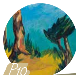
P10 Vie quotidienne