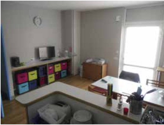
Logement de fonction