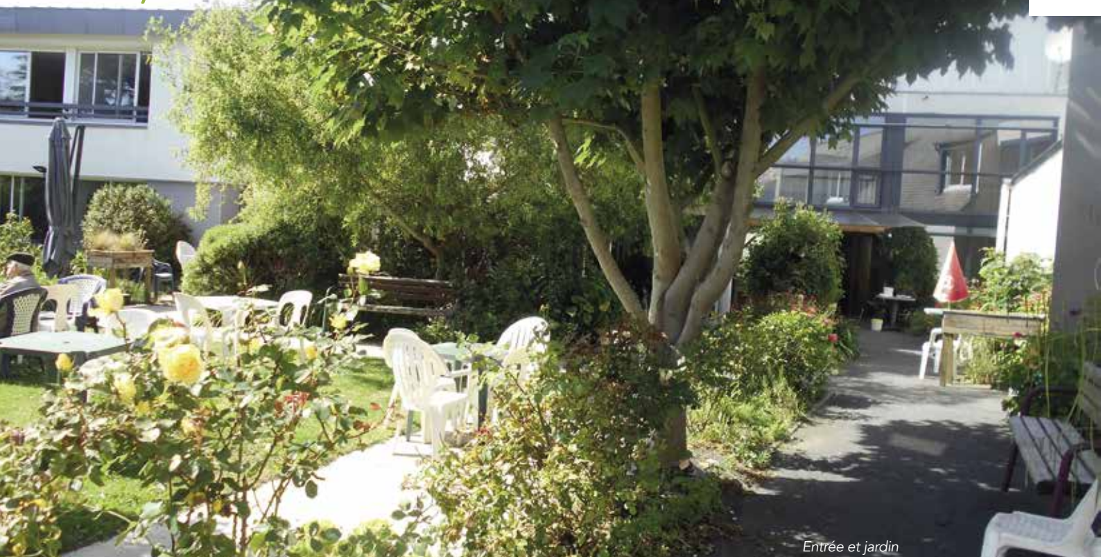
Entrée et jardin