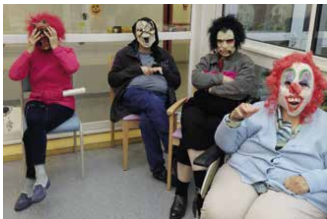
Halloween : les résidents attendent les enfants