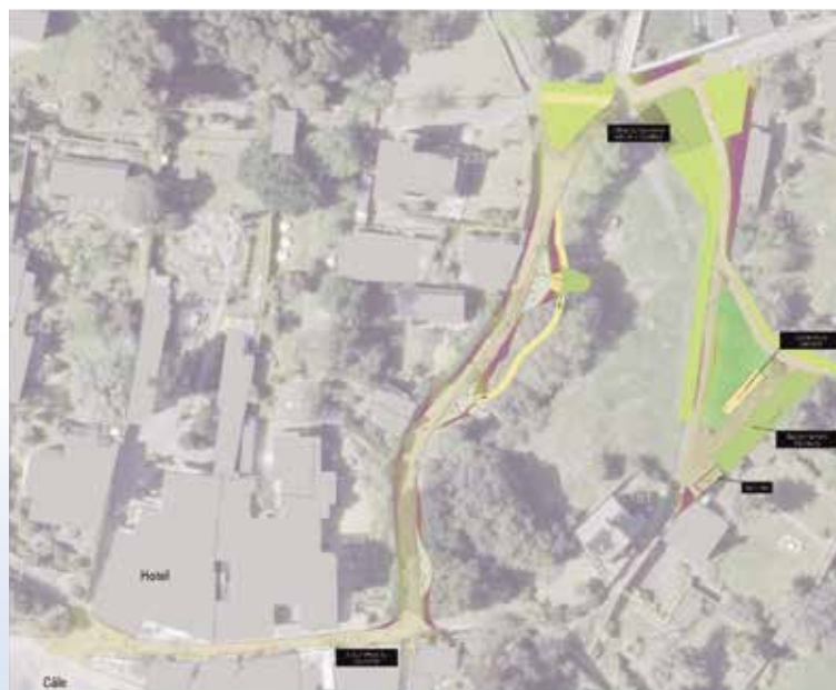
Horizons Paysage et Aménagements

La montée du Port Clos se répartit en quatre parties : le débarcadère et la montée bâtie, la voie arborée, la placette et la zone technique.